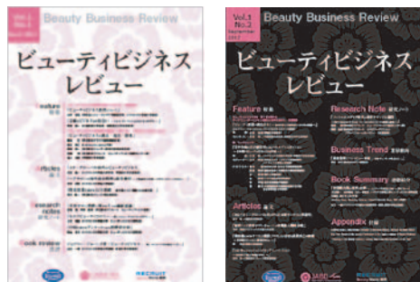
▲『ビューティビジネスレビュー』

ビューティビジネスに関わる論文、研究ノート、業界動向、書評のほか、全国大会の基調講演全文など、毎号多彩な内容が掲載されています。